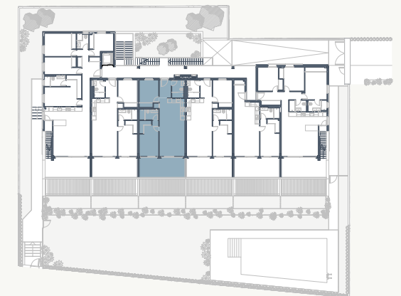
Planta de conjunto